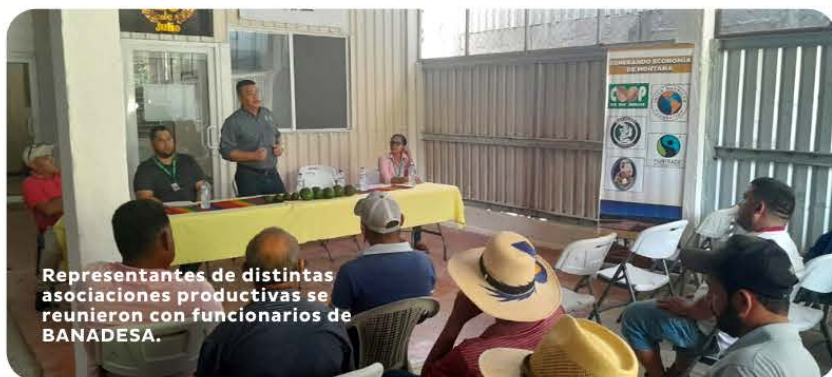
Representantes de distintas asociaciones productivas se reunieron con funcionarios de BANADESA.

El banco del pueblo, continúa reactivándose y mostrando ese apoyo constante para todo el sector agropecuario nacional, gracias al impulso brindado por el Gobierno de la Presidenta Xiomara Castro, que busca brindar seguridad alimentaria a toda la población hondureña.