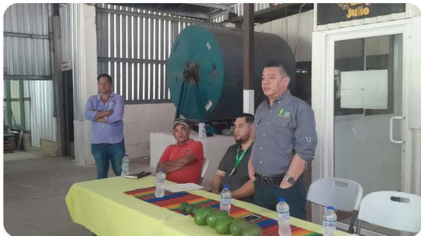
Presidente Ejecutivo de BANADESA, Eryln Menjívar en reunión con productores y ganaderos en departamento de Yoro.

Victoria, Yoro, 18 de octubre de 2023.- Con el objetivo de conocer las inquietudes de los productores y ganaderos de este sector el Presidente Ejecutivo del Banco Nacional de Desarrollo Agrícola, BANADESA, Eryln Menjívar, visitó la comunidad de Las Vegas, durante su reciente gira por este departamento. Aquí se reunió con unos 80 representantes de las Cooperativas Cafetaleras 25 de Julio, Cooperativa Subirana, Cooperativa Tegucigalpa y APROCAL; cultivadores de aguacate y productores de ganado de leche y engorde de este municipio.