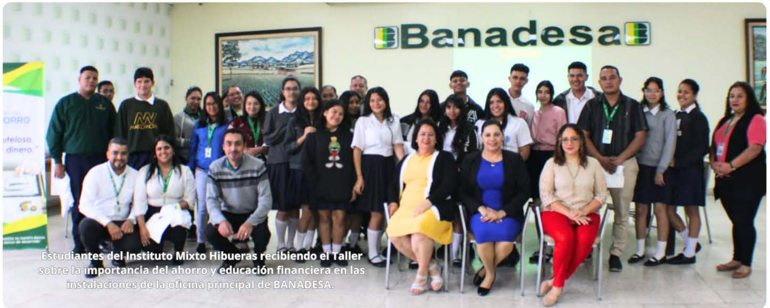
Estudiantes del Instituto Mixto Hibuera recibiendo el Taller sobre la importancia del ahorro y educación financiera en las instalaciones de la oficina principal de BANADESA.