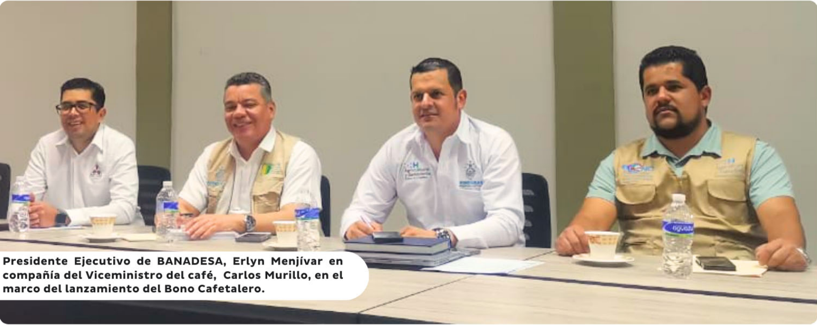
Presidente Ejecutivo de BANADESA, Eryln Menjivar en compañía del Viceministro del café, Carlos Murillo, en el marco del lanzamiento del Bono Cafetalero.

Con el objetivo de brindar estrategias de financiamiento para el sector caficultor y llevar una respuesta a los pequeños y medianos productores que tienen dificultades para acceder a una línea de crédito, se reunieron este día representantes del Banco Nacional de Desarrollo Agrícola BANADESA y del Bono Cafetalero, en un conversatorio para llegar a acuerdos sobre la implementación de estos beneficios para el rubro del café.