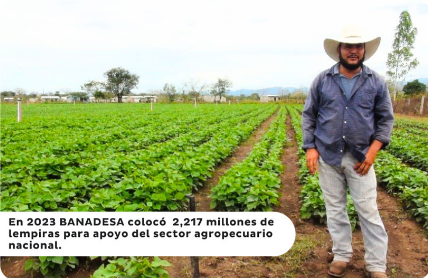
En 2023 BANADESA colocó 2,217 millones de lempiras para apoyo del sector agropecuario nacional.

Cabe mencionar que esta institución cerró 2023 con 2,217 millones de Lempiras, colocados en créditos para beneficiar con bajas tasas de interés a 5700 productores en todo el país y apoyando financieramente unas 70 cadenas de valor agrícola.