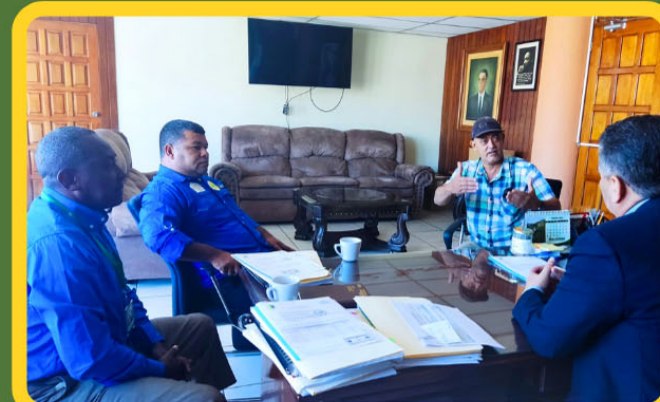
Directivos de Cooperativa Brisas Coaqueñas en reunión con funcionarios de BANADESA.